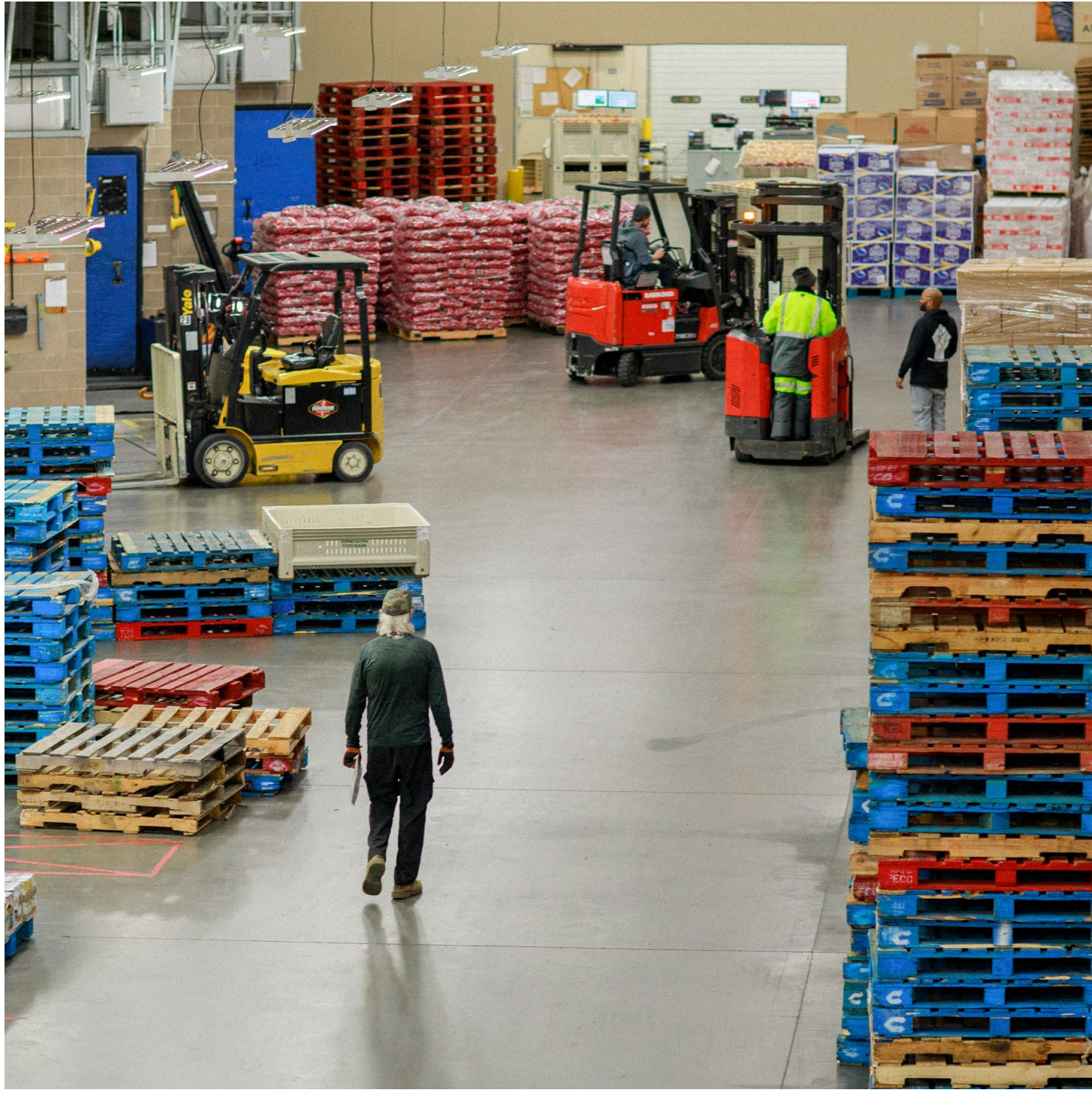
El almacén estatal en NE Portland