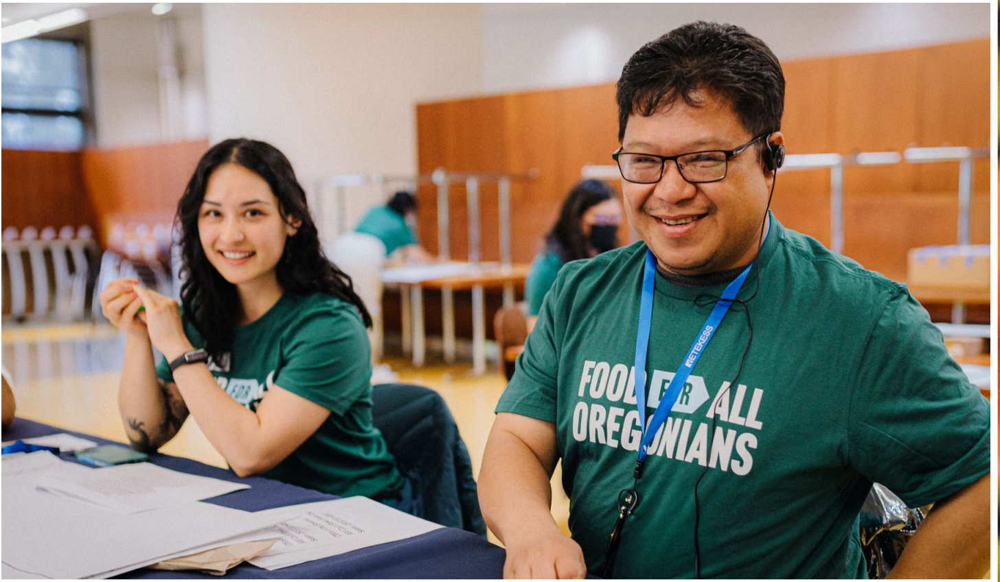
Participantes en la cumbre de estrategia de Alimentos para todos en Oregón en abril de 2024

Además, los legisladores aprobaron financiamiento para mejorar el acceso a comidas para niños en proveedores de guardería elegibles a través del Programa Child and Adult Care Food Program (Programa de alimentos para el cuidado de niños y adultos).