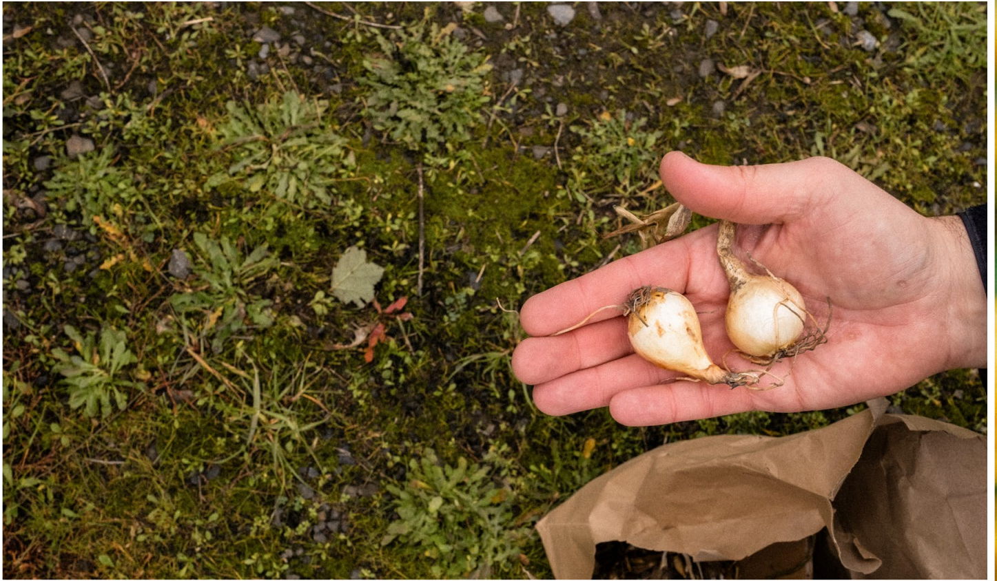
Bulbos de camas maduros

de pueblos originarios. "La comunidad de los pueblos originarios está muy dispuesta a compartir sus conocimientos. Compartimos información, recursos y también sabiduría tradicional. Otros agricultores o cultivadores me enseñan nuevas técnicas y comparten su experiencia, ya sea a través de educación formal o tradicional".