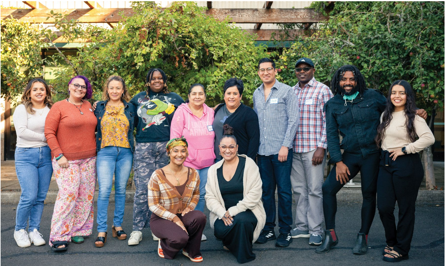
12 miembros del Consejo de Liderazgo Político 2024-2025