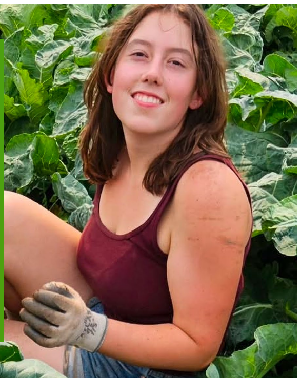
Un voluntario que trabaja en la granja juvenil de FOOD For Lane County

Cuando la Granja Juvenil de FOOD For Lane County estuvo a punto de perder sus terrenos, la comunidad se arriesgó a perder tanto alimentos frescos como oportunidades educativas para los jóvenes agricultores. Oregon Food Bank estuvo presente para ayudar, facilitando fondos estatales y donaciones privadas para que la organización adquiriera un terreno de 25 acres y así mantener la Granja Juvenil en funcionamiento. Lea más en OregonFoodBank.org/FoodForLaneCounty-ES ✨