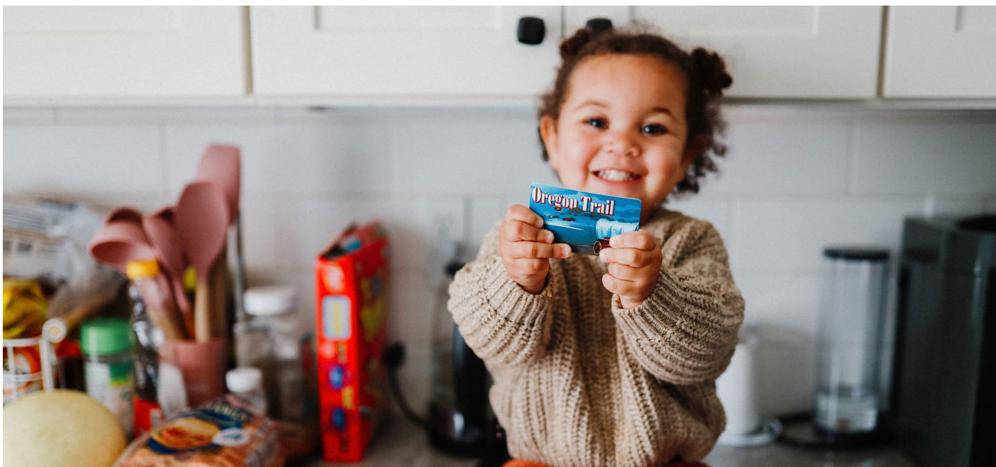
Una niña con la tarjeta SNAP de Oregon, un programa que verá nuevos límites debido a la H.R. 1